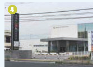
なかにし眼科クリニック