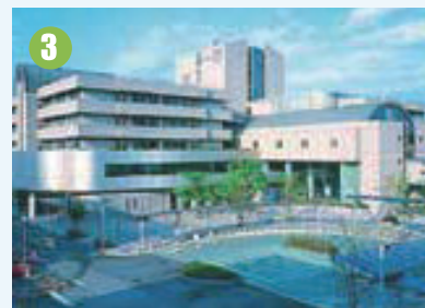
県立総合リハビリテーションセンター